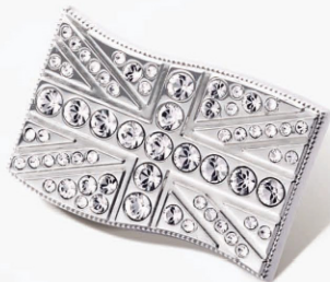
UNION JACK BXユニオンジャック