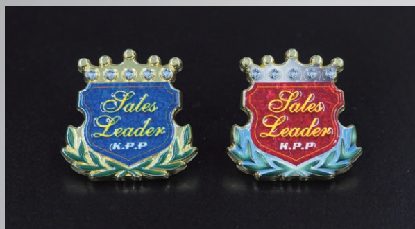
【サンプルB】 28×20mm ニッケルメッキ】